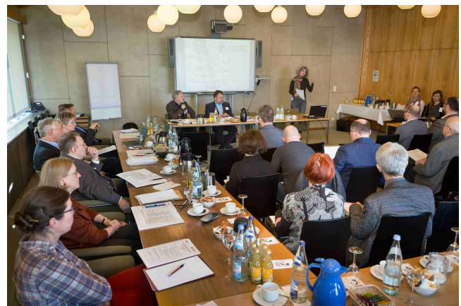
Links: Die Expertinnen und Experten im kollegialen Austausch beim Mittagimbiss